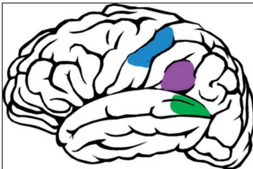
Figura 1. Áreas involucradas en la red vestibular cortical, vista lateral. En azul: Corteza parietal somatosensorial. En rosa: Corteza vestibular parieto-insular (PIVC). En verde: Área temporal medial superior.

Hallazgos indican que, en humanos, las áreas corticales parietal posterior y temporal medial superior se activan durante la estimulación vestibular 17,19,27,28 y que ambas estarían involucradas en procesos relacionados con la representación espacial, la codificación de la aceleración del cuerpo y su diferenciación respecto a otros objetos en movimiento 21,29-31 . Otras de las áreas relacionadas con el procesamiento de la información vestibular son la circunvolución del cíngulo, la que estaría conectada en red con otras cortezas involucradas en el sistema del equilibrio, y la corteza retrosplenial (Figura 2), que tendría un rol en la navegación espacial y en la integración de trayectoria, procesos que permiten relacionar los cambios de posición en el espacio, utilizando claves internas como la actividad vestibular (aceleración lineal y angular) y la propioceptiva, para actualizar la dirección y la distancia recorrida entre un punto en el espacio y otro(s) 32-36 .