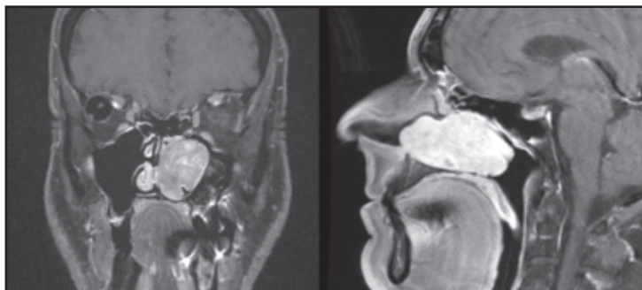
Figura 3. RNM preoperatoria con Gd (enero 2013): masa sólida que ocupa ampliamente la fosa nasal izquierda que es hipointensa en T1, levemente heterogénea e hiperintensa en T2 y que presenta una intensa y heterogénea captación con el medio de contraste. Ella expande la fosa nasal, rechazando y remodelando el paladar duro y principalmente la pared medial del seno maxilar izquierdo y el septo nasal, sin llegar a destruirlos. Hacia posterior se proyecta a la rinofaringe alcanzando la abertura de la trompa de Eustaquio sin obliterarla; no afecta laberinto etmoidal ni la órbita, tampoco el canal nasolagrimal ni hay compromiso de la base de cráneo.