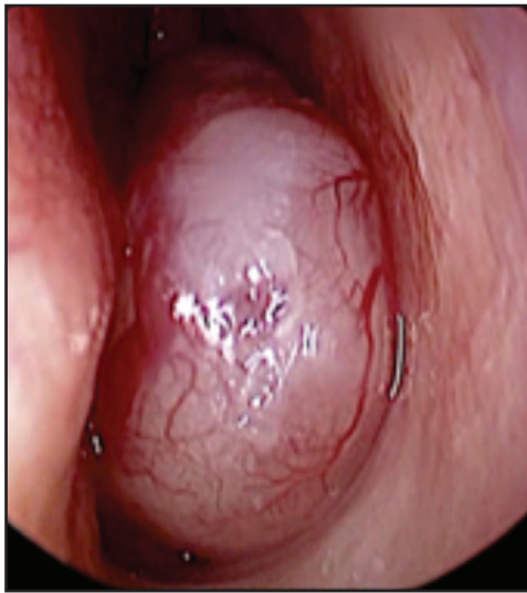
Figura 1: Visión a la endoscopia de la tumoración en la fosa nasal izquierda.

de alrededor de un mes de evolución, rinorrea de tipo seromucosa y de predominio nocturno. Como antecedentes, había sido extraído un quiste radicular de la pieza 13 cuatro años antes de su consulta. En su infancia (al año) fue tratado de un retinoblastoma (operado e irradiado) a derecha y que fue de tipo esporádico y no familiar hereditario; hemitiroidectomía por nódulos tiroideos y lipomas múltiples en distintas localizaciones. En el examen nasal no se encuentra una deformidad externa, sí una lesión que ocupa casi la totalidad de la fosa nasal izquierda en sus dos tercios inferiores y de aspecto polipoideo, rosado, con aumento de la vascularización en su extremo anterior (Figura 1). Se solicitan exámenes de imagen: Tomografía computarizada de cavidades perinasales (TC de CPN) y una resonancia nuclear magnética de cara con gadolinio (RNM con Gd), (Figuras 2 y 3).